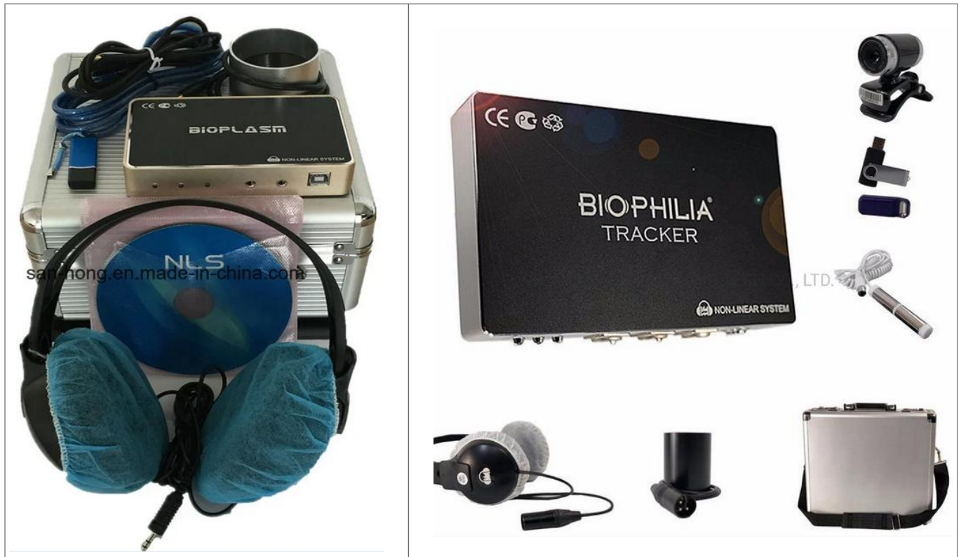
Levo: NLS – Bioplasm ima 300 etalonov NLS – Biophilia ima več kot 5000 etalonov